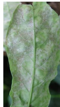
Sporenrasen auf der Blattunterseite

An Kirschlorbeer tritt er jedoch anders in Erscheinung als bei anderen Kulturen. Der für den Pilz typische weiße, mehlartige Belag bildet sich auf der Blattunterseite statt Oberseite und ist zudem weniger stark ausgeprägt. (Achtung: Verwechslungsgefahr mit Falschem Mehltau!). Der Pilz befällt bevorzugt junge, frische Triebe und Blätter. Er verursacht dort Blattaufhellungen, wellenartige Blattdeformationen, aber auch Verkorkungen auf der Blattunterseite. Bei einem starken Befall können ganze Triebe absterben.