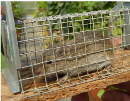
Wühlmaus in einer Lebendfalle

Nach der Bundesartenschutzverordnung zählt neben der Spitzmaus (reiner Insektenfresser!) auch der Maulwurf , der sich von Insekten wie Regenwürmern und Larven ernährt, zu den besonders geschützten Arten. Anhand verschiedener Merkmale lässt sich gut zwischen einem Maulwurf- und Wühlmaushügel sowie den Spuren der Feldmaus unterscheiden.