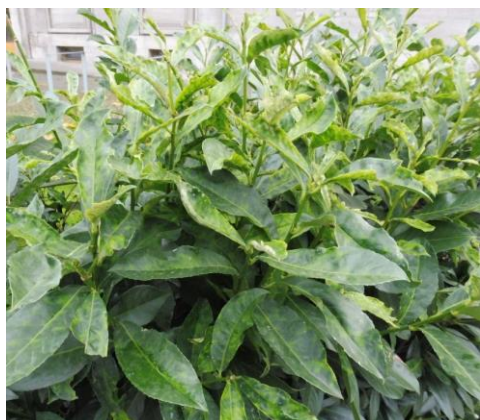
Kirschlorbeer mit Blattaufhellungen und Blattdeformationen

Vorbeugend sollten Quitten nicht zu spät geerntet werden: bereits beim Farbumschlag von grün nach gelb und abnehmender Bepelzung ist der richtige Zeitpunkt erreicht. Lange und vor allem zu kalte Lagerung ist zu vermeiden. Früchte mit Fleischbräune lassen sich aber trotzdem uneingeschränkt verarbeiten, die Fruchtfleischverfärbung ist nur eine optische Beeinträchtigung.