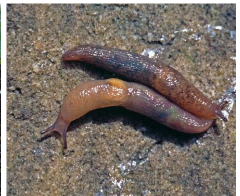
zwei Genetzte Ackerschnecken

Um den Entwicklungszyklus zu unterbrechen, lohnt es sich, Schneckeneier zu suchen und zu vernichten. Die Eier sind kugelig, 2 bis 3 mm groß, durchsichtig bei Ackerschnecken und milchig weiß bis gelblich bei Wegschnecken. Sie werden in kleineren oder größeren Gruppen abgelegt, pro Schnecke 50 bis 150 Stück!