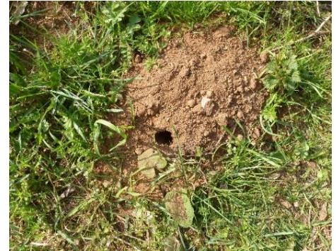
Wühlmaushügel mit seitlichem Eingang

Wühlmäuse (Schermäuse) und Feldmäuse können an Zwiebeln, Wurzeln und Knollen verschiedener Kulturen sowie am Stammgrund von Bäumen und Gehölzen starke Fraßschäden verursachen. Betroffene Bäume, Rosen und Sträucher treiben schwächer bzw. verzögert im Frühjahr aus und bilden kleineres, hellgrünes Laub. Stauden welken und lassen sich leicht aus dem Boden ziehen. Rasenflächen werden in ihrer Optik durch Erdhaufen und Erdlöcher an der Oberfläche verunstaltet.