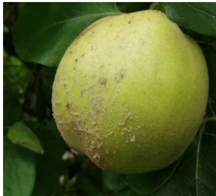
Quitte mit typischer "Bepelzung" der Fruchtschale