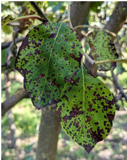
Blattbräune an Quittenblättern

Feuchte Witterung fördert den Befall mit Blattbräune an Quitten . Die Blätter zeigen anfangs kleine rötlich violette Blattflecken, die später braun werden. Bei starkem Befall fließen die Flecken zusammen, die Blätter werden früher abgeworfen. Es handelt sich um den Blattpilz Entomosporium mespili , syn. Diplocarpon m. , der sich besonders rasch bei Blattnässe ausbreitet, er kann auch Früchte befallen.