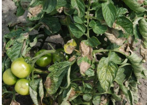
Erste Symptome durch Kraut- und Braunfäule an Tomaten