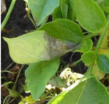
Schwarzbraune wässrige Flecken an Kartoffellaub durch Kraut- und Braunfäule – Laub entfernen!