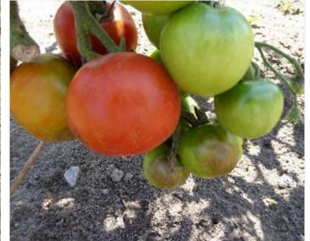
Durch Kraut- und Braunfäule befallene Tomaten